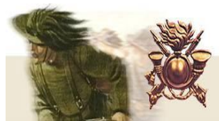
ASS. NAZ.LE BERSAGLIERI